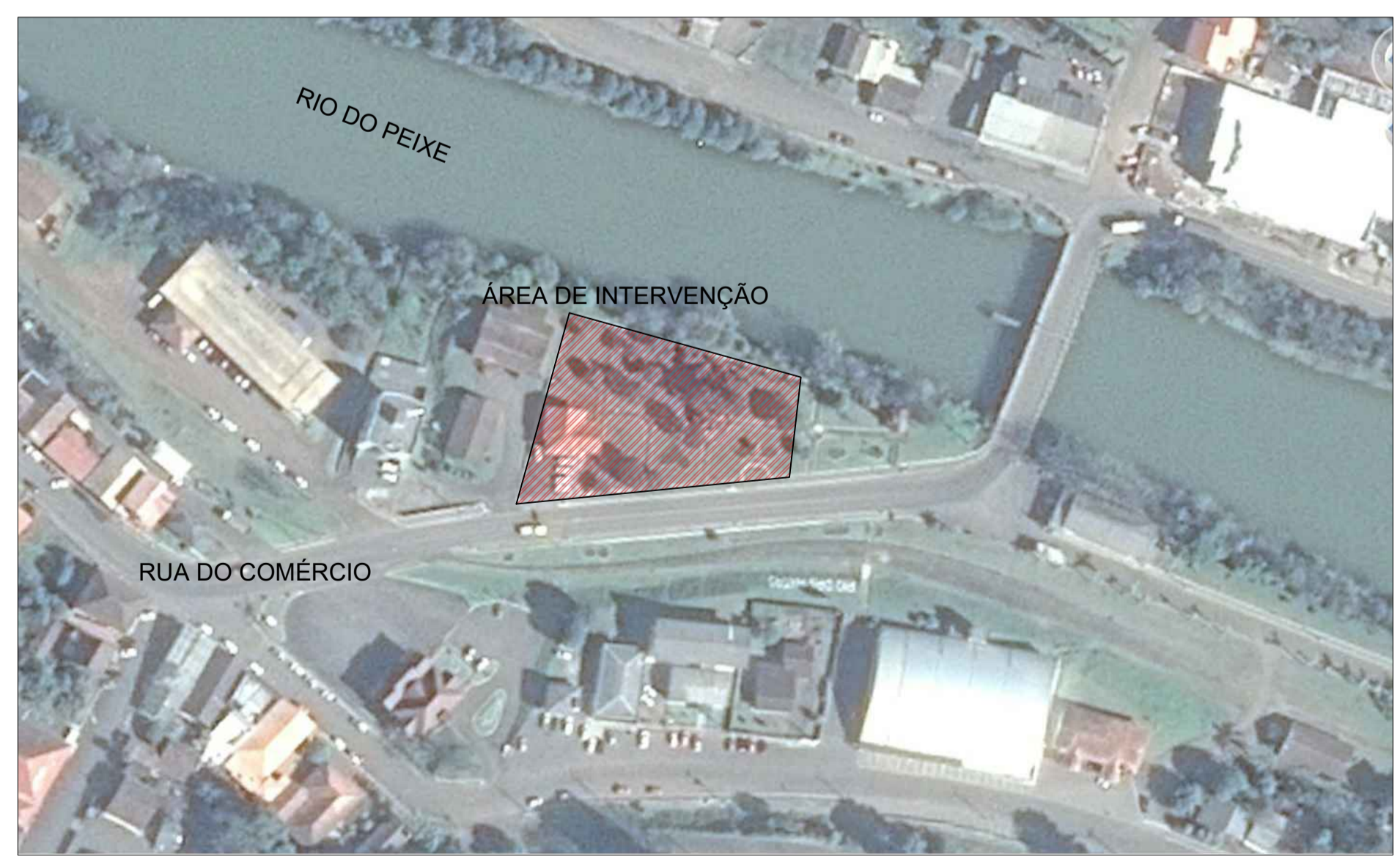
PLANTA DE LOCAÇÃO / SITUAÇÃO SEM ESCALA